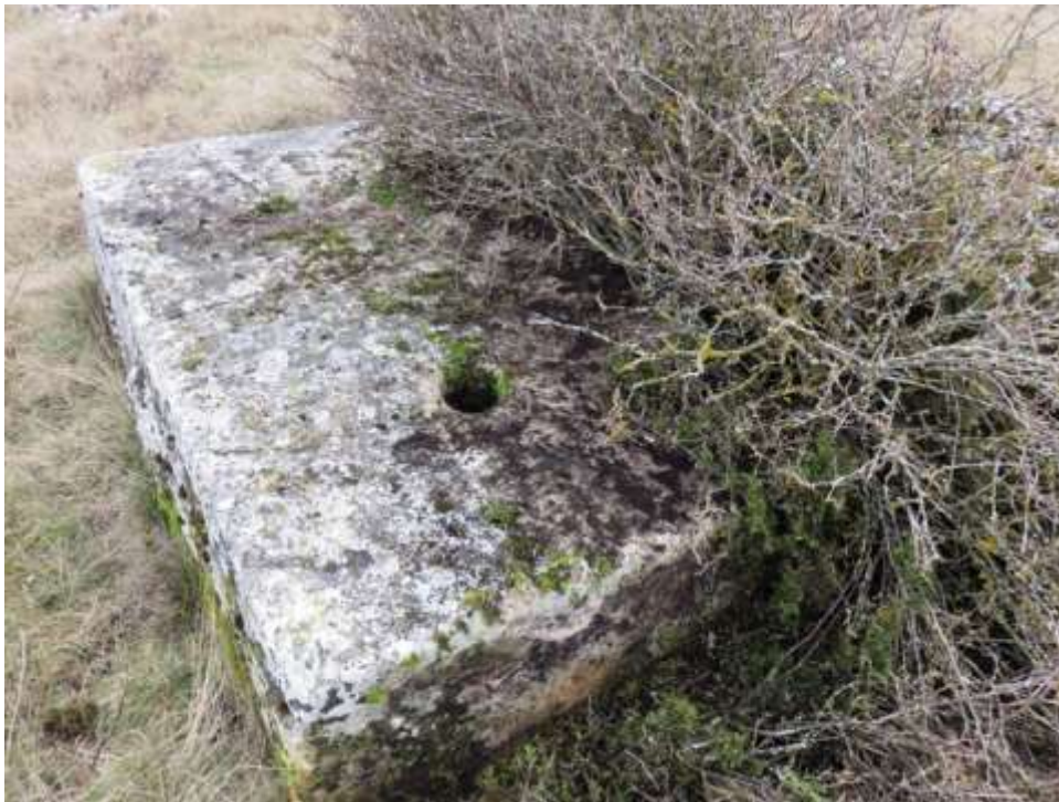
Сл. 6. Ваган. Некропола средњег вијека