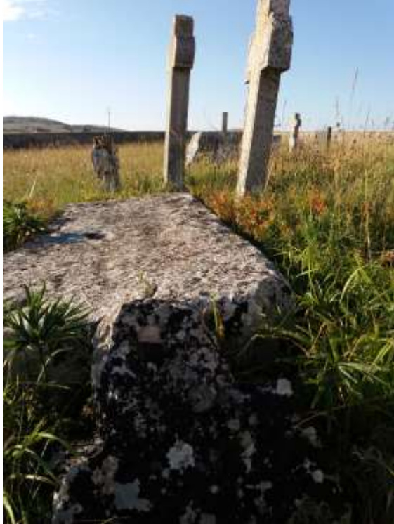
Сл. 5. Роре: слика континуитета. Солидније клесани споменик типа сандука. Уз њега српско гробље XIX-XX вијека