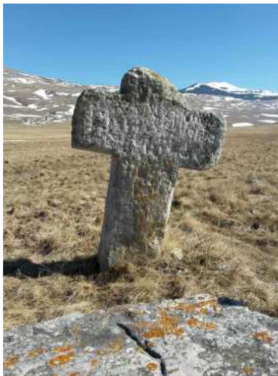
Сл. 4. Прибеља. Стећак типа сандука до надгробног крста