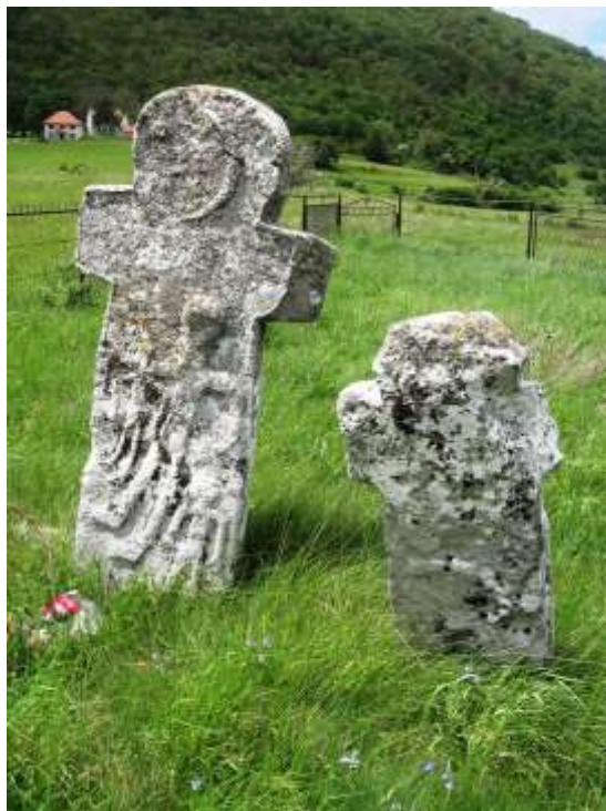
Сл. 2. Натпис на старом крсту у Пердухову: 1834. година