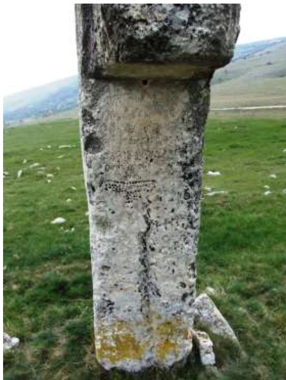
Сл. 3. Гробље у Старом селу. Споменици 16. вијека. Овдје и савремено српско гробље.